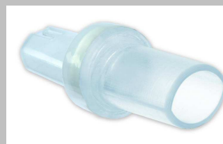
Embout « D »