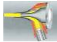
Eclairage Fibre Optique